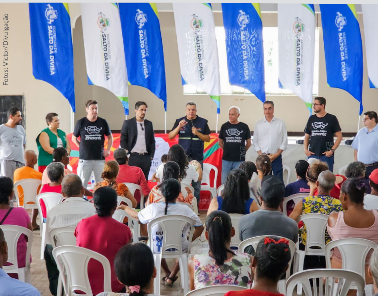
Promotores de Justiça, representando o Ministério Público; representantes da Defensoria Pública, do Tribunal de Justiça e demais parceiros do projeto; integrantes do poder público municipal; lideranças e membros da comunidade local.

JACINTO | Salto da Divisa, Santo Antônio do Jacinto e Santa Maria do Salto