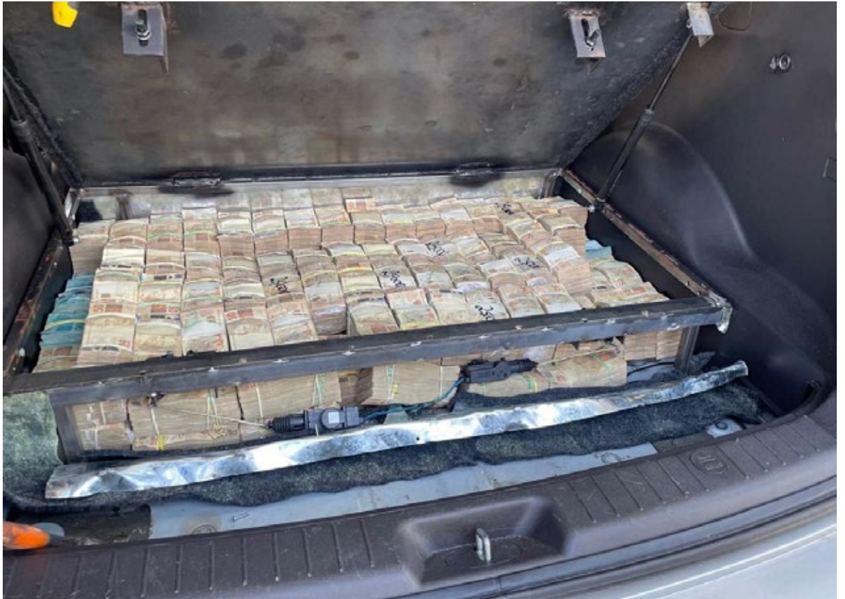
Operação “Castelo de vento”, que investigou crimes no comércio e subprodutos do abate de gado.

foi criado o Comitê Interinstitucional de Recuperação de Ativos do Estado da Bahia – CIRA-BA. Como todos os entes federativos, o estado sofre relevante perda de receita com sonegação fiscal e com fraudes estruturadas, e tinha dificuldade de reaver o dinheiro público desviado.