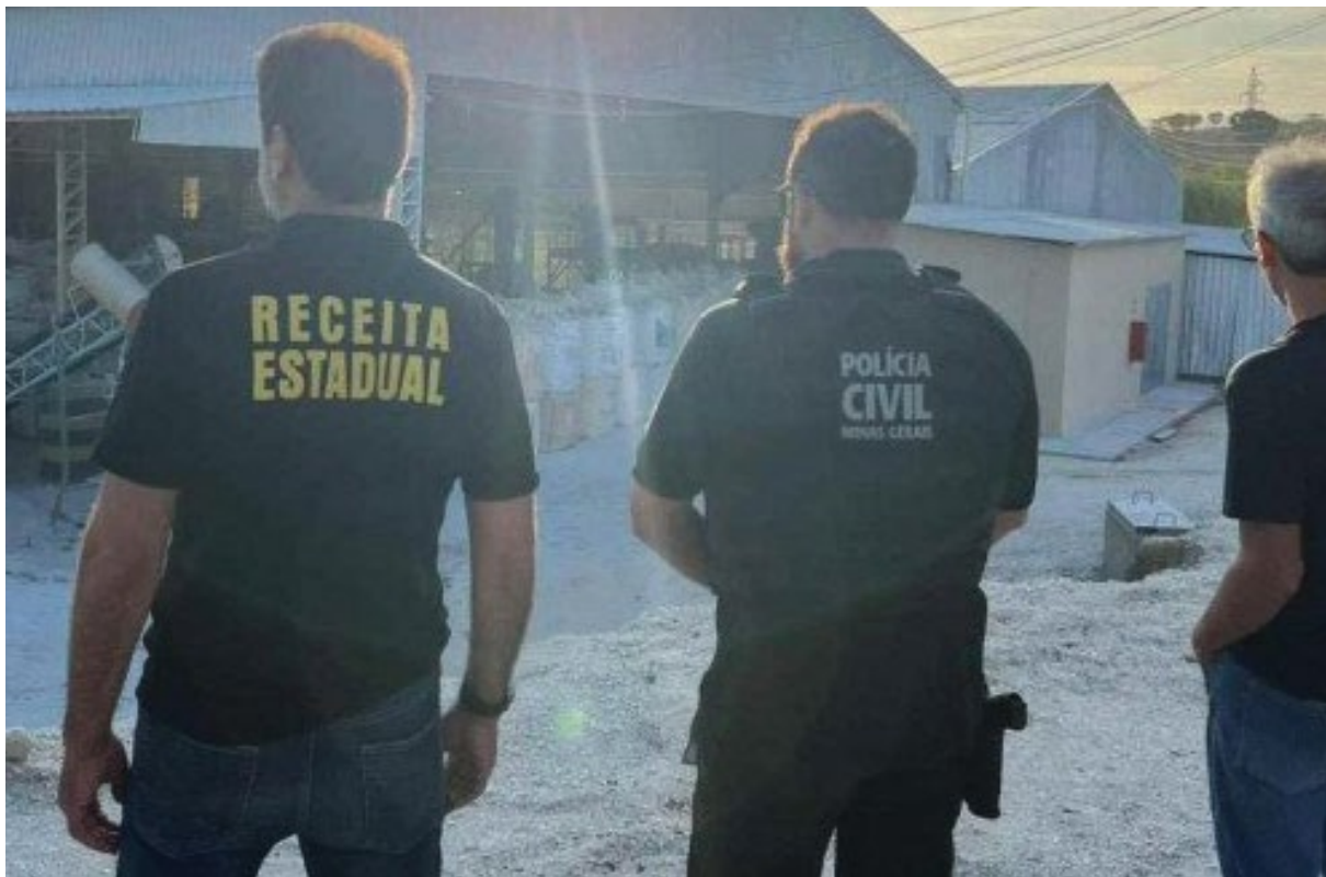
Operação “Fel de Minas”, realizada pelo CIRA-MG, em 2023, contra crimes de sonegação fiscal e lavagem de dinheiro no setor da mineração.

do mais de R$ 16 bilhões desviados pela sonegação em Minas Gerais. Tal resultado fez com que órgãos de outros estados e de outras esferas do Poder Público se aproxi-