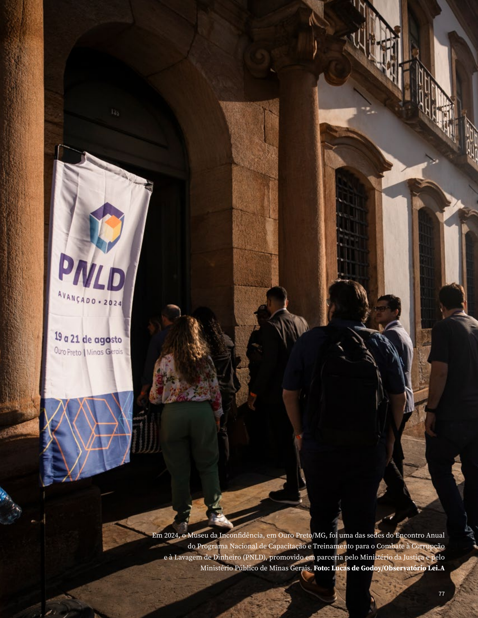
Em 2024, o Museu da Inconfidência, em Ouro Preto/MG, foi uma das sedes do Encontro Anual do Programa Nacional de Capacitação e Treinamento para o Combate à Corrupção e à Lavagem de Dinheiro (PNLD), promovido em parceria pelo Ministério da Justiça e pelo Ministério Público de Minas Gerais.