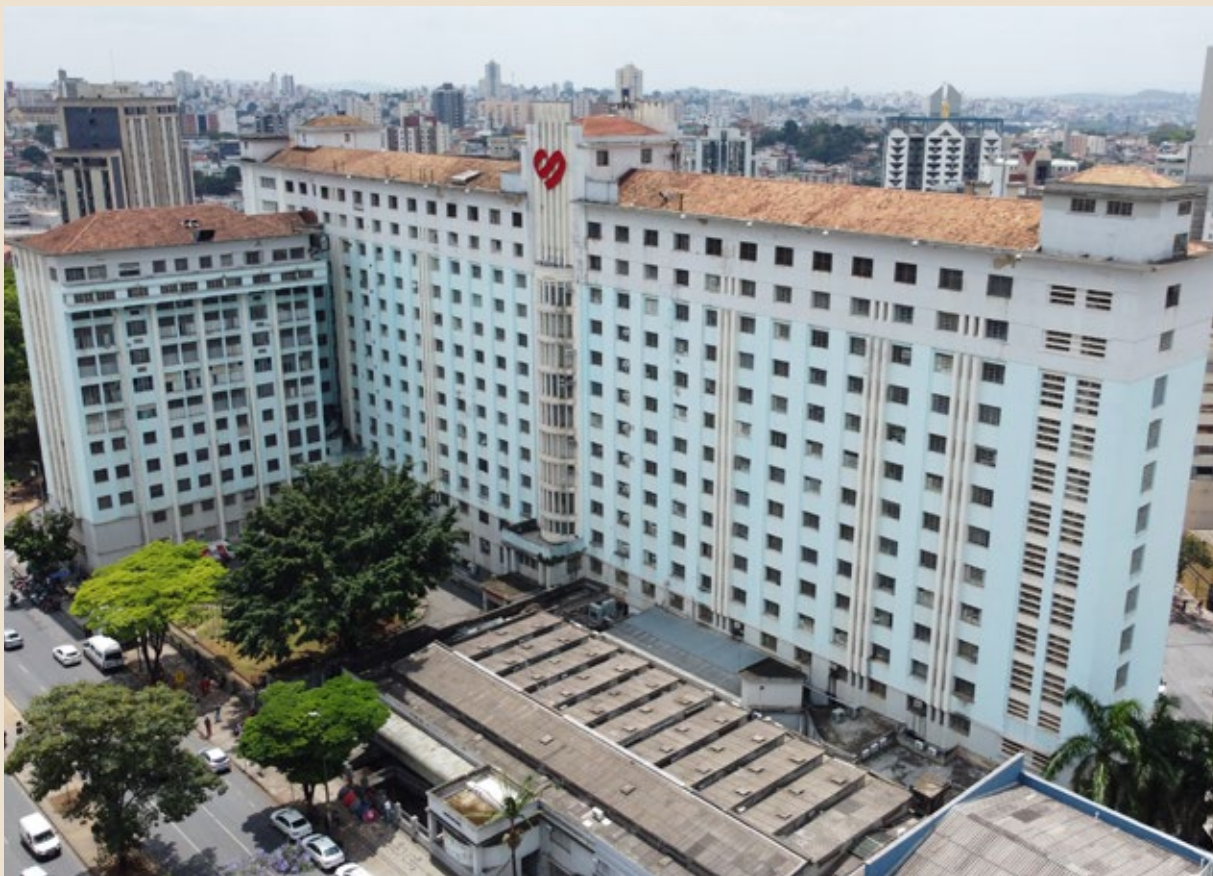
Ativos recuperados e indenizações pagas por crimes econômicos e tributários foram revertidos em recursos para obras de modernização da Santa Casa de Belo Horizonte.

Em alguns casos específicos, os bens recuperados foram imediatamente usados para fins solidários, como a doação de 20 mil pares de calçados apreendidos para projetos sociais. Em outros, eles puderam ser revertidos para iniciativas de capacitação nos próprios setores, como o financiamento de programa para catadores de materiais recicláveis.