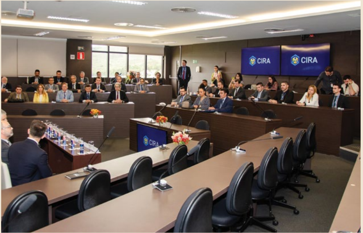
A capacitação e treinamento constante é um dos eixos estruturantes do CIRA 360°.

diante de tantos desafios novos, sempre mais complexos e tecnológicos.